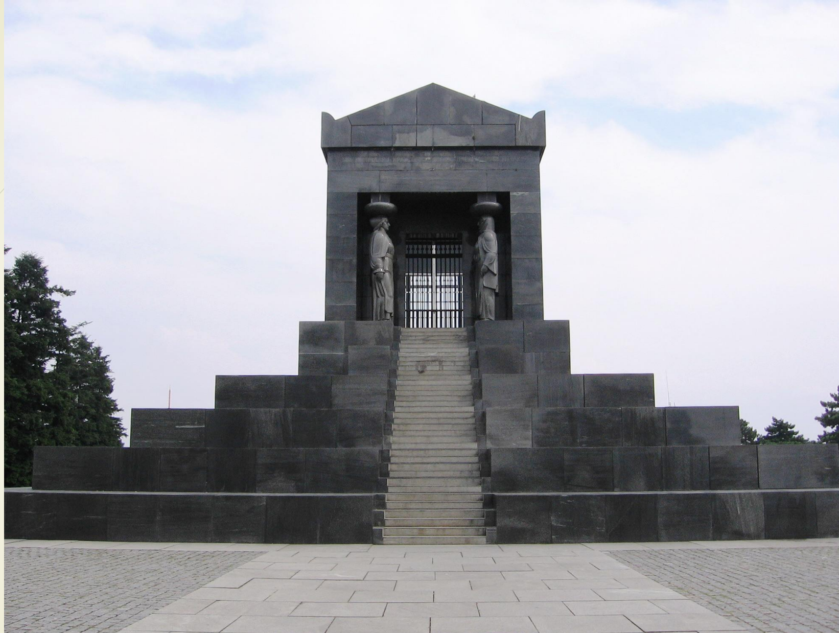
➤ Споменик незнаном јунаку на Авали