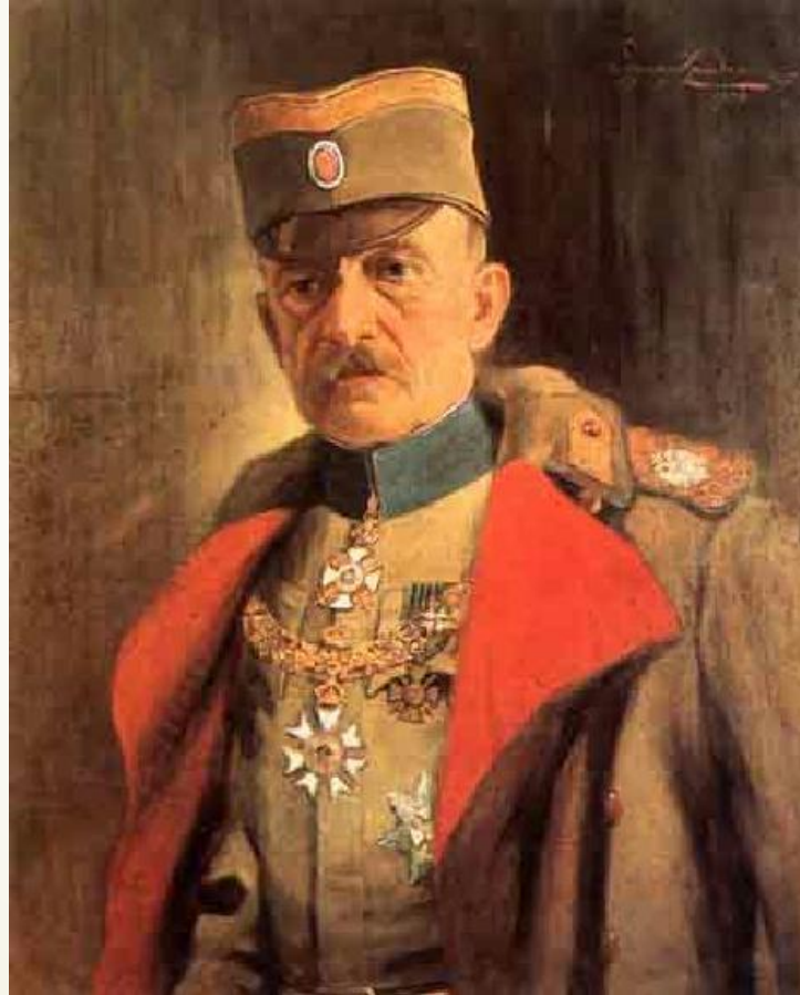
Војвода Живојин Мишић