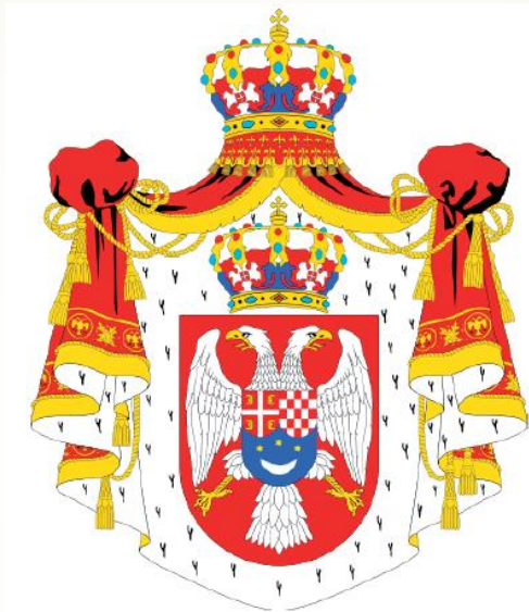
Грб Краљевине Срба, Хрвата и Словенаца