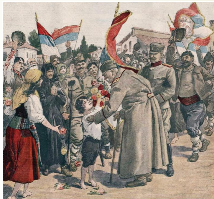
Повратак победника у Србију