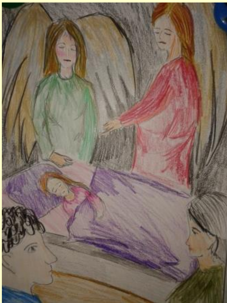
„Моја породица под крилима анђела“ – Милена Росић