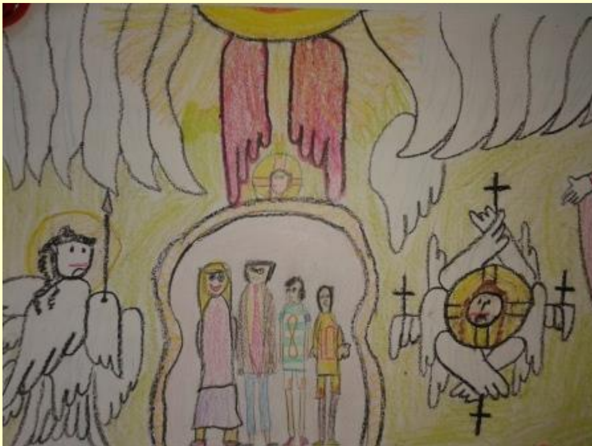
„Моја породица под крилима анђела“ – Ђорђе Јовановић