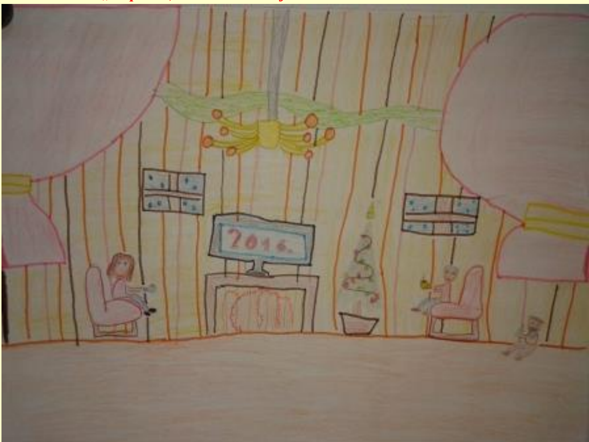
„Празнична атмосфера у нашој породици“ – Вук Пејић