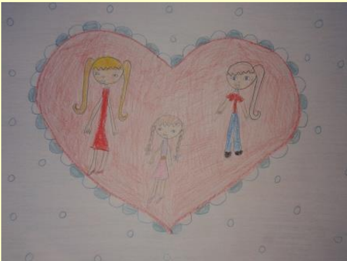
„Моја породица у мом срцу“ - Тара Остојић