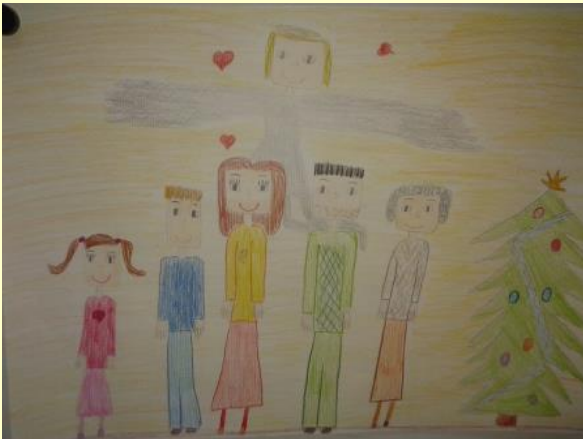
„Моја породица под крилима анђела“ – Анђела Живковић