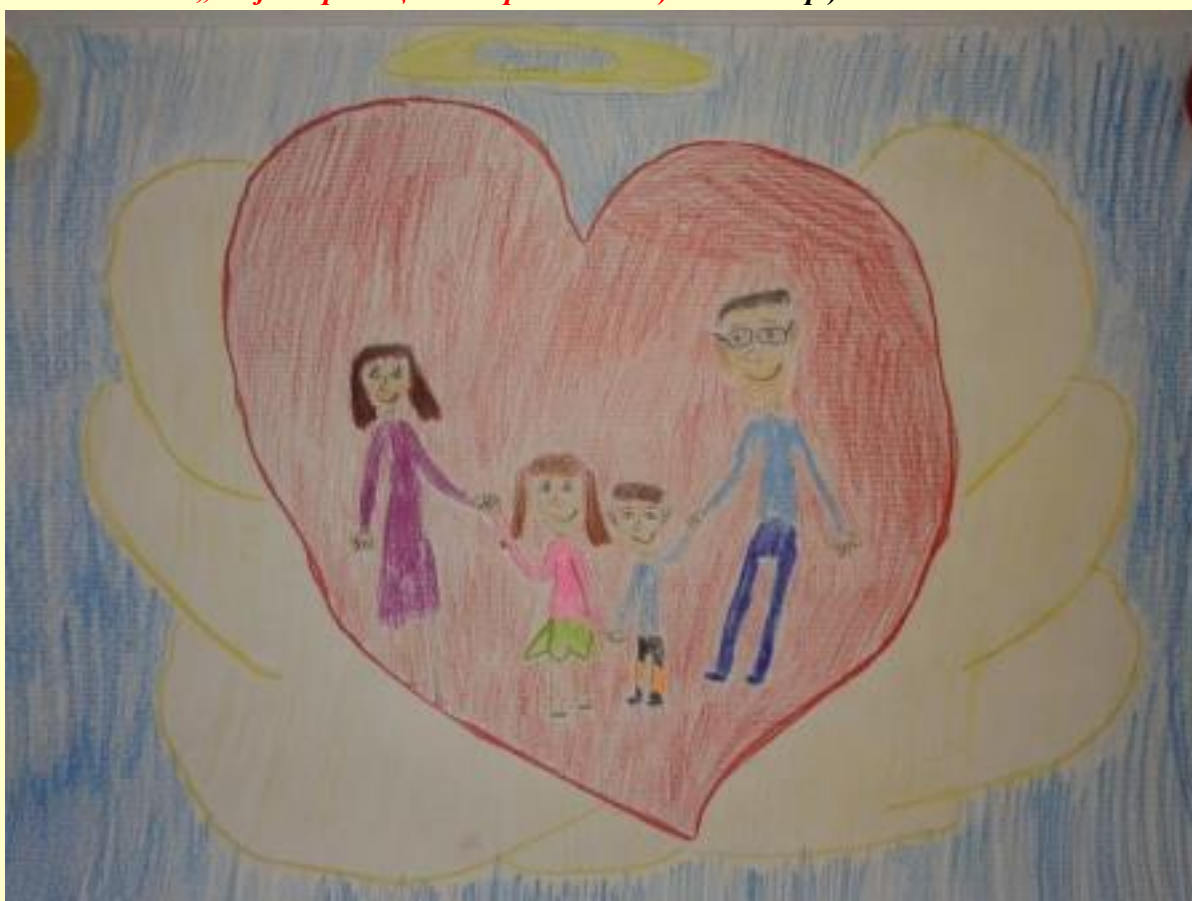
„Моја породица под крилима анђела“ – Лана Пантелић