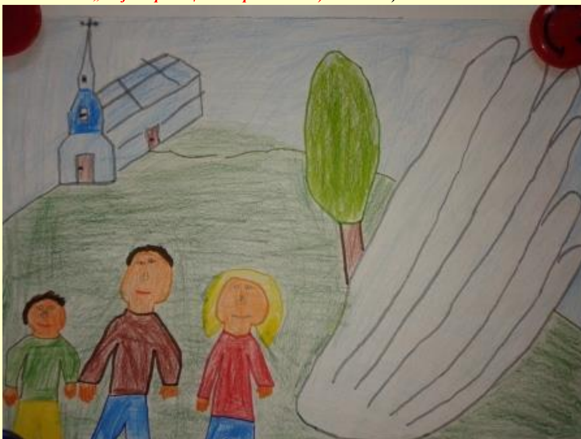
„Моја породица под крилима анђела“ – Дарио Мушћет