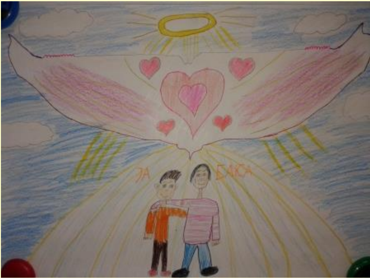
„Моја породица под крилима анђела“ - Никша Вранеш