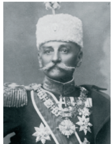
Краљ Петар I Карађорђевић

Тражен је повод да се започне рат и пронађен је у догађају који се десио 28. јуна 1914. године. Млади Србин Гаврило Принцип убио је у Сарајеву наследника аустроугарског престола Франца Фердинанда и његову жену. Иако се овај инцидент догодио на територији Аустроугарске, Србија је оптужена да је одговорна за атентат и објављен јој је рат. Убрзо су се у овај рат укључиле и друге државе.