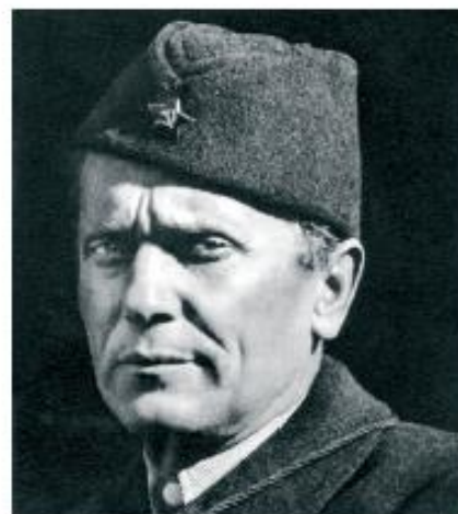
Јосип Броз Тито

Након завршетка рата, на простору некадашње Краљевине Југославије створена је нова држава – Федеративна Народна Република Југославија (ФНРЈ). На чело државе дошао је вођа партизанског покрета Јосип Броз Тито. Касније је назив државе промењен у Социјалистичка Федеративна Република Југославија (СФРЈ), а остала је упамћена по скраћеном називу Југославија.