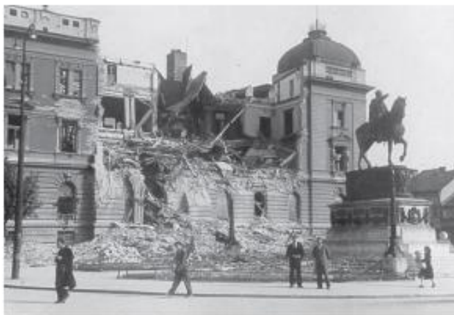
Последице бомбардовања Београда

Немци су оснивали и посебне затворе – логоре за све које су сматрали непријатељима. Велики број људи страдао је у логорима. Неки су убијени, а неки су умрли због лоших услова или мучења.