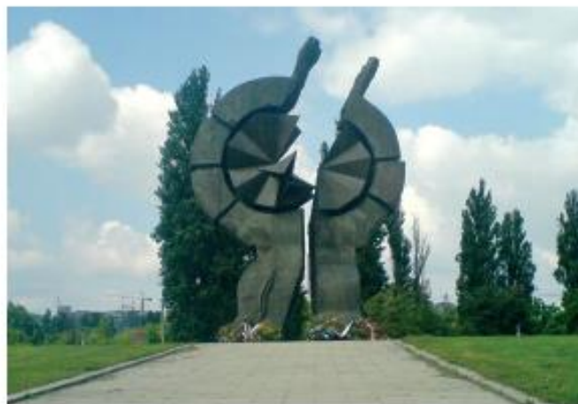
Споменик жртвама логора Старо сајмиште у Београду