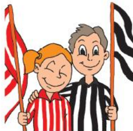
Навијачица Црвене Звезде и навијач Партизана