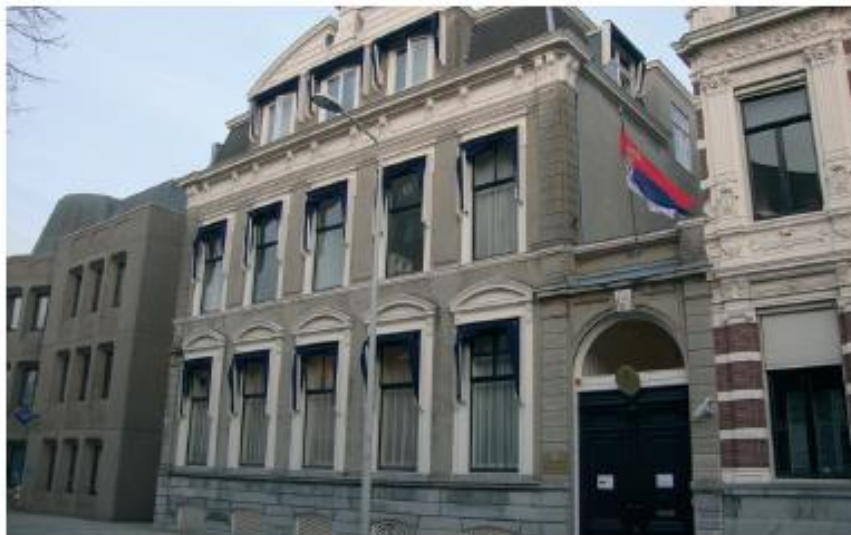
Амбасада Србије у Холандији

Србија је од 2006. године поново самостална држава – Република Србија.