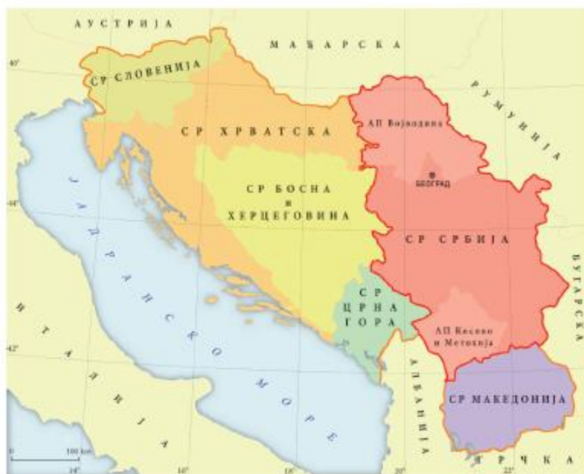
Карта Социјалистичке Федеративне Републике Југославије